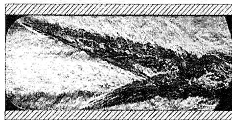
Fig.2 Schlieren photograph of the pseudo-shock wave