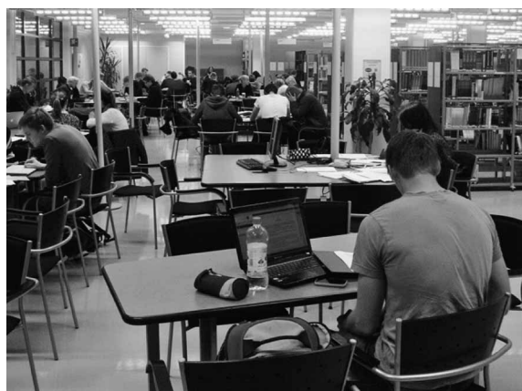
写真3 University of Oulu の Science and Technology Library Tellus

その理学部と工学部の図書館である Science and Technology Library Tellus は、ラーニング・センターとしての側面も併せ持つ 9) 。入館すると、たくさんの個人用のパソコン席が出迎える。中ほどまで進むと、書架やコピー機、プリンター、さらに人数に応じて自由に組み合わせられるテーブルが並ぶ。写真3のようにひとりから5、6名のグループまで学生たちが賑やかな学習空間を構成しており、ラーニング・コモンズに近い印象を受けた。