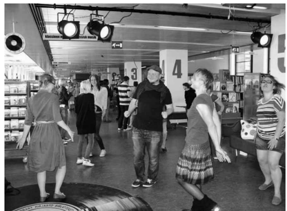
写真5 図書館でランチタイムディスコ！

Library 10 は Pasila Library の音楽部門等を母体として独立した図書館である。ヘルシンキ市の中央郵便局の2階にあり、館名は住所（番地）に由来する。ここでは、CDを聴いたり、借りたりだけでなく、ギター等の楽器やスタジオも備えており、演奏・収録もできる。また、館内の書架やカウンターにはキャストが付いており、移動が可能である。それ以外の備品も軽く、持ち運ぶことができる。これは図書館に対する新しいニーズを受け、空間作りを資料中心から利用者中心へと転換したことによる。こうしたフレキシブルな空間は、演奏会やワークショップ等の場としても活用されている。写真5のランチタイムディスコもその一例である。なお、同図書館で開かれるイベントのうち8割が市民