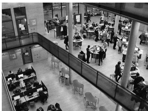
写真1 Learning Centre Aleksandria

University of Helsinki はヘルシンキの都心にあり、その中央図書館は外壁を放物線状にくりぬいたような窓が印象的な建物である。図書館に隣接して Learning Centre Aleksandria がある。