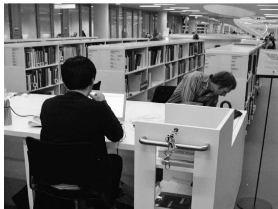
写真2 Helsinki University Library でキャスター付きキャビネット（右手前）を利用する学生

学生に人気のサービスはキャスター付きのキャビネットのレンタルである。28日間図書だけでなく勉強道具一式を入れておけるため、身軽に来館し、好きな場所で学習を再開できる。他の学習施設と比べた際、図書館の強みはたくさんの紙の資料を収集できる点にあるが、それを支えるサービスと言えよう。これは後述の Oulu University Library でも確認できた。