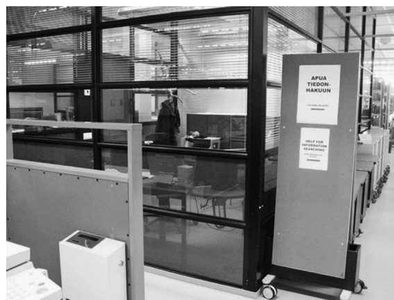
写真4 図書館職員のオフィス

なお、図書館職員のオフィスはどれも個室か数名規模の小部屋で、1フロアに島が並ぶオフィスは見