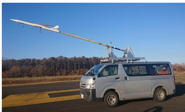
図3 走行試験機材の全景