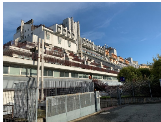
図 8 ジェノバ大学本部中庭(左), 図書館へと続く廊下(中央), 化学・工業化学科建屋(右)