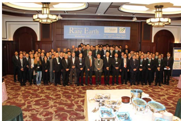
図2 Muroran-IT Rare-Earth Workshop 2018(左), 2017(右)集合写真