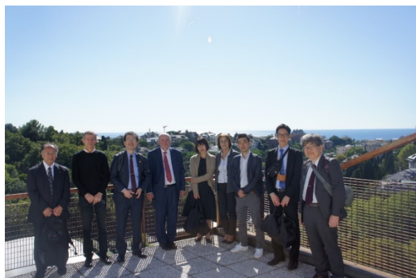
図 7 調印式の様子(左), 化学・工業化学科屋上での集合写真(右)