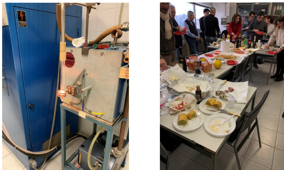
図 9 高周波誘導炉による試料作成の様子(左), クリスマスパティー(右)

いくつかの希土類マンガ金属間化合物の可能性を洗い出し、いくつかの候補を定めて高周波誘導加熱炉を用いた熔融合成を行った（図 9 左）。高周波誘導加熱自体は古くからある金属間化合物の合成法であるが、本実験のスペシャリストである Manfrinetti 教授は独自の技術と経験を持ち合わせており、実験の奥深さを改めて思い知らされた。プロトタイプ合成といくつかの候補物質の合成を試みたが、3 か月と言う滞在期間はあっという間に過ぎ（途中クリスマスもあったので）満足のいく合成には至らなかった。