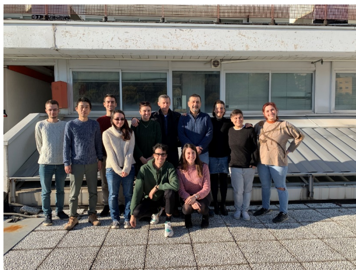
図 10 物理化学グループ研究室メンバー

たった3か月でも語りきれないくらいのエピソードはあるが、これらの経験は私にとってかけがえなく重要なものになったことは間違いない。できればもう1度ゆっくり行ってみたいが、その前に学生や若手研究者に異文化や異なる言語の中で生活や研究をすることの素晴らしさを伝え、新たにチャレンジする人が現れることを願っている。