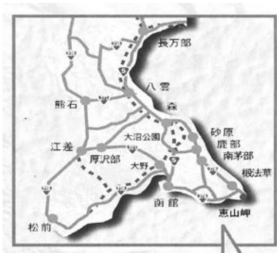
図1：渡島半島全体地図

海事語彙とは、波や潮流、風や天候、地形など漁業を取り巻く環境に関連した語彙をいう。地理上の場所と密接に結びついているので、参考に渡島半島全体の地図を挙げておく。