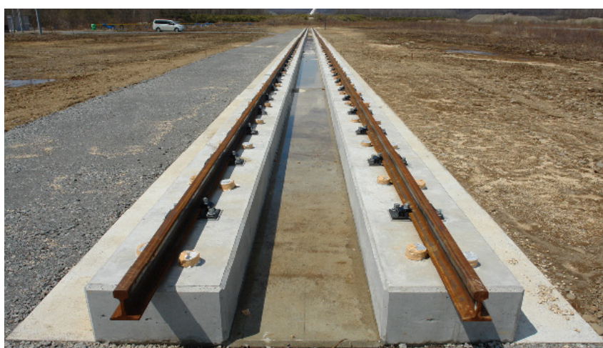
図 2 フルスケール高速走行軌道装置