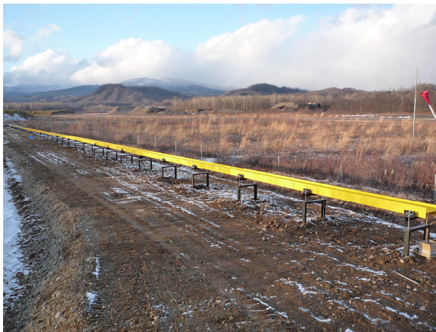
図 1：サブスケール高速走行軌道装置

本研究では、フルスケール高速走行軌道装置（軌道長約 2~3[km]）構築への基盤研究として、サブスケール高速走行軌道装置（軌道長 100[m]、図 1）を本センターの白老エンジン実験場に設置した。また、高速走行軌道装置に用いられる減速手法についての研究を行った。