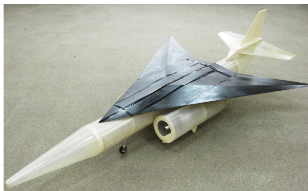
図 2. 機体のモックアップの製作

この構造案を元にして、平成 21 年度にはプロトタイプ機体を製作する計画である。また、今後多様な予備的な飛行試験に対応できるよう飛行可能領域（エンベロープ）を徐々に広げるのに併せて、剛性の高い CFRP 構造に移行しつつ、空力弾性技術を適用する。飛行制御系についても当初は無線操縦とし、徐々に自律飛行に移行しつつ自律飛行技術の予備実証を実施する計画である。