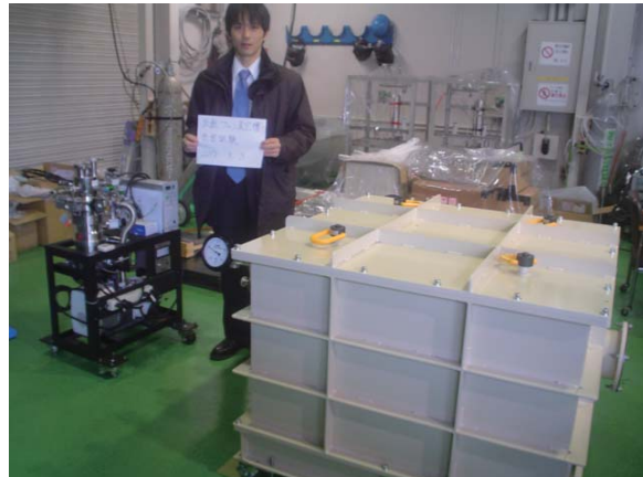
図2 真空槽単体の真空引き試験

真空引き・気密試験の結果、一部のフランジに空気漏れが見つかったが、それ以外では気密がとれていたことが分かった。この空気漏れがあったフランジについては2012年度に改善する予定である。