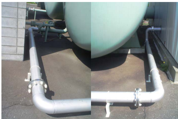
図4 風洞タンクと真空槽の配管接続状態

真空槽設置後, 超音速風洞と試験装置の間の真空引き・気密試験を実施した. 一部の真空槽のフランジからの微量の空気漏れは残っていたものの, 超音速風洞の真空タンク容積(500m 3 )と比較して極めて微量であるため無視できる量であり, 真空ポンプを止めて一昼夜風洞タンクを真空に保持しても, 風洞タンクの圧力は殆ど上昇しなかった.