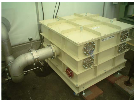
図3 設置後の反転ファン試験装置真空槽