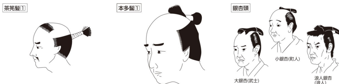
図3：茶筌鬘、本多鬘、銀杏鬘

ただ、現代語で言うところの「ちょんまげ」はいわゆる鬘の総称であるため、織田信長のような茶筌鬘でも、本多忠勝で知られる本多鬘でも、時代劇でおなじみの銀杏鬘でも、なんでもかんでも「ちょんまげ」と呼んでいる。だから、正式な名称を知らずに現代語の感覚で呼ぶのであれば、冠下の髻も茶筌鬘のような感じでちょんまげと呼ぶことは十分受け入れられるであろう。茶筌鬘、本多鬘、銀杏鬘の説明は図とともに示しておく。