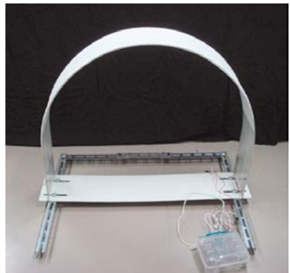
図1 擬似夜明け療法器の試作器

本研究に試作した擬似夜明け療法器の外観を図1、その調光プログラムを図2に示す。フレームは、株式