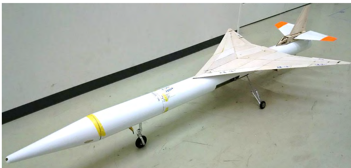
(b) 外殻を被せた状態