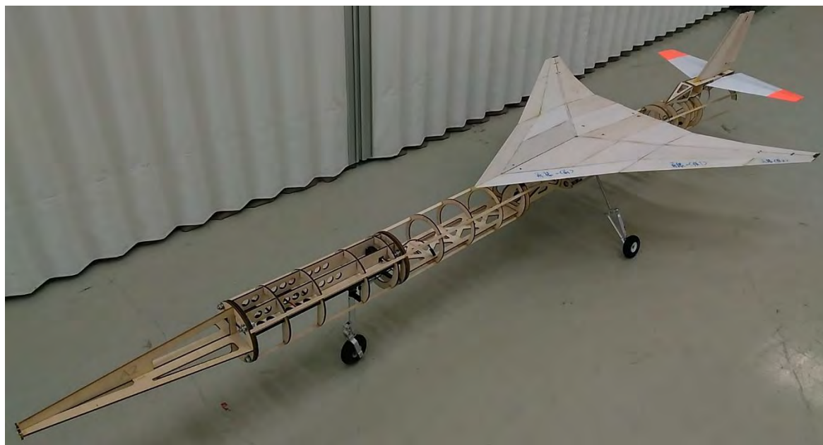
(a) 骨組み構造の仮組みの様子

機体内部構造の主要な製作手法として、ベニヤ板・バルサ板から構造部材をレーザーカッターで精密に切り出し、手作業で接着する。翼の前後縁や舵面は、厚手バルサ板から手作業で削り出す。一方、翼面外皮は厚さ 1 mm のバルサ板、胴体外皮はグラスファイバークロス・バルサ薄板のサンドイッチ材とエポキシ樹脂による FRP 円筒である。表面仕上げはオラカバフィルム貼付である。試作された機体の外観を図 2 に示す。引き込み脚を搭載し自立できる。今後の外注製作の参考とするために、内部構造を観察できるように表面仕上げを施す前にとどめている。