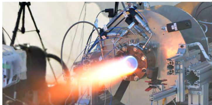
図2 Rotating Detonation Engine の燃焼実験

名古屋大学で研究されている Rotating Detonation Engine および Pulse Detonation Engine を JAXA/ISAS の観測ロケットに搭載し, 飛行試験を平成 31 年度に実施予定である。フライトモデル相当の統合推進システムを白老実験場にて実証した。