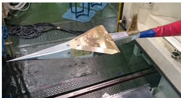
図3 RBCC エンジンを模擬したスペースプレーン機体模型

前年度に引き続き、Rocket-Based Combination Cycle(RBCC)エンジンを搭載したスペースプレーンの実現のために必要なエンジン・機体統合の空力設計技術の指針を獲得することを狙って、機体形状を提案し、機体模型を試作して、内蔵ロケットからの排気を模擬したガス噴射状態での風洞試験を JAXA/ISAS 遷音速風洞において実施した。ガス噴射による空力変化の計測について、ガス供給配管の内圧、および冷却による軸力の評価が課題であることが判明した。